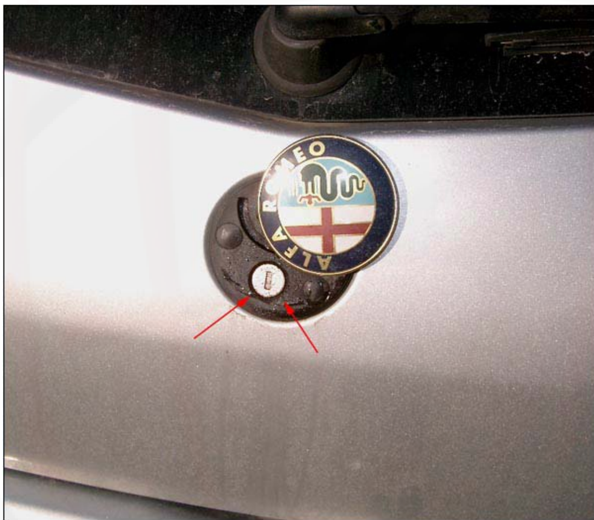
Serratura baule posteriore

Solo sulle prime 147 (del 2000/primi mesi 2001) era possibile aprire il baule dall' esterno con la chiave, sulle altre si apre solo da telecomando o dal cruscotto. Ruotando il logo Alfa Romeo si accedeva alla serratura: